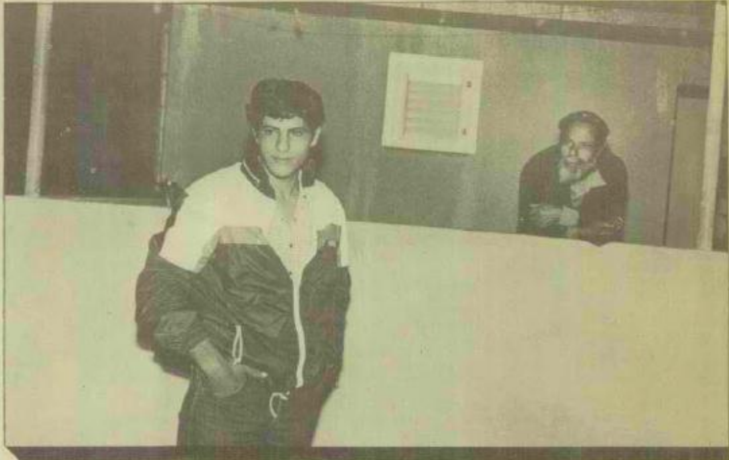
סומלס נגרי, יורש נגרי, מליך שטר חימני והיפסו

אורי מסרב להצטלם או להודות בשמו המלא. "התרגלתי למנטליזת זיקית (הוא מדבר גמנית שוספת) ואחרי הדרכים הכי חשובים אצלם זה לשמוע על השם הטוב."